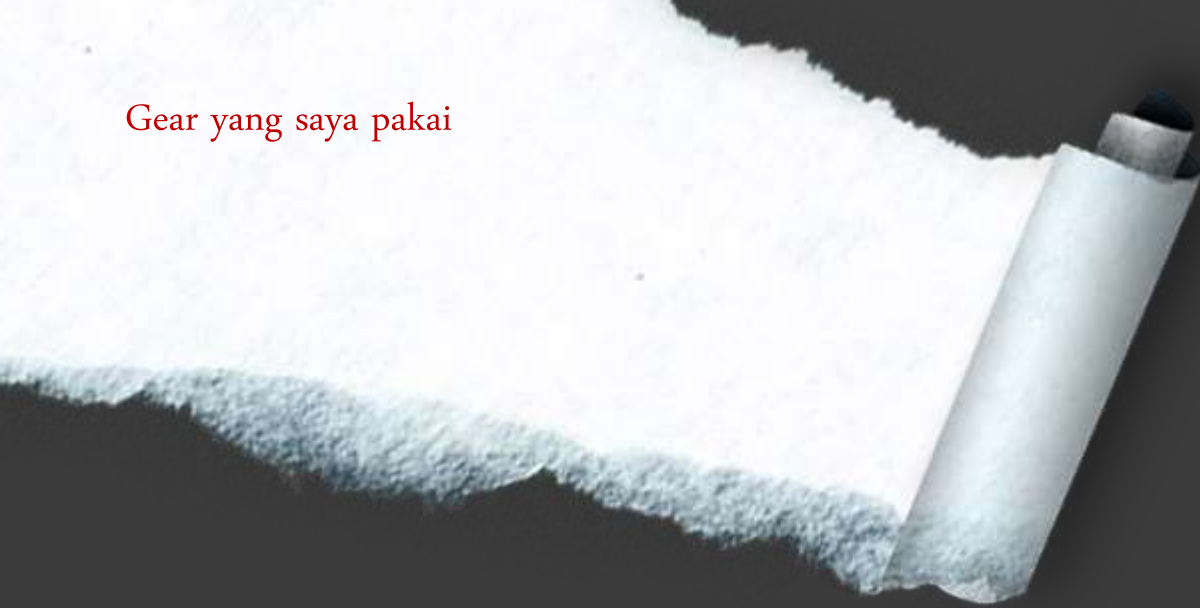
Foto-foto pada Buku ini diambil menggunakan