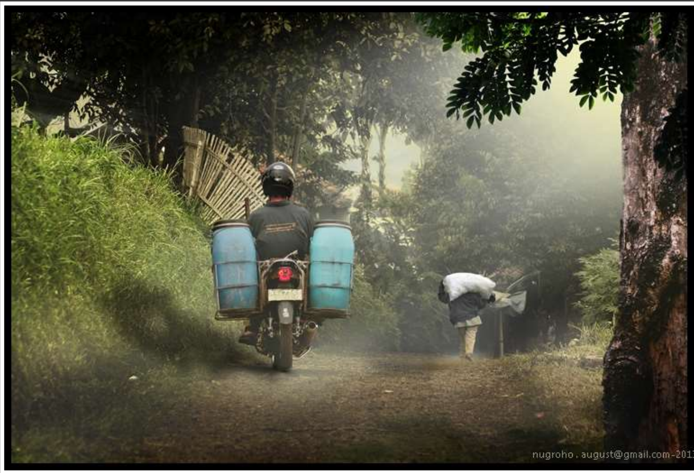
Ketika pagi menjelang Pakuhaji, Bandung Barat.